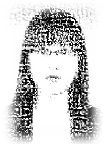
연구소 데이터는 모두 내 것?