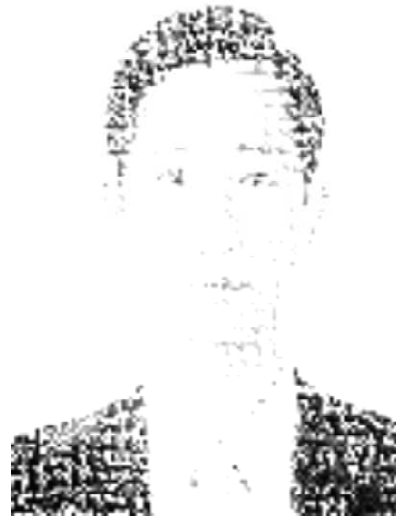
정보공개+비밀 모두 내 손에