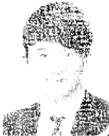
기록관리 만사 OK!!