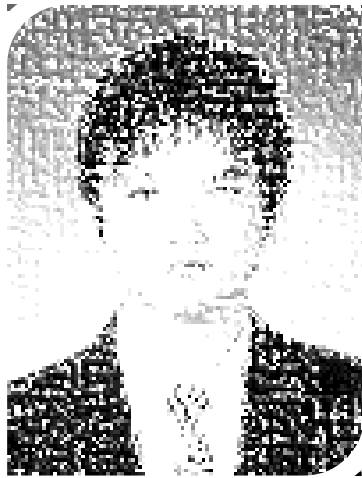
주니어보드 의장 무내미 편집위원